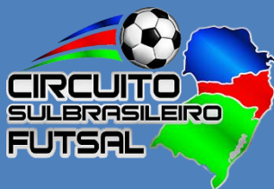
TABELA DO SUB 17 E LIVRE MASCULINO. DIA 25/06/23 (DOMINGO) – GINÁSIO PADRE JOÃO STOLD TEMPO DE JOGO: 02 TEMPOS DE 15 MINUTOS