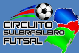
TABELA DOS JOGOS: CATEGORIAS SUB 11, SUB 13 E SUB 15 MASCULINO DIA 24/06 (SÁBADO) – GINÁSIO DO IMIGRANTE - TEMPO DE JOGO: 02 TEMPOS DE 15 MINUTOS